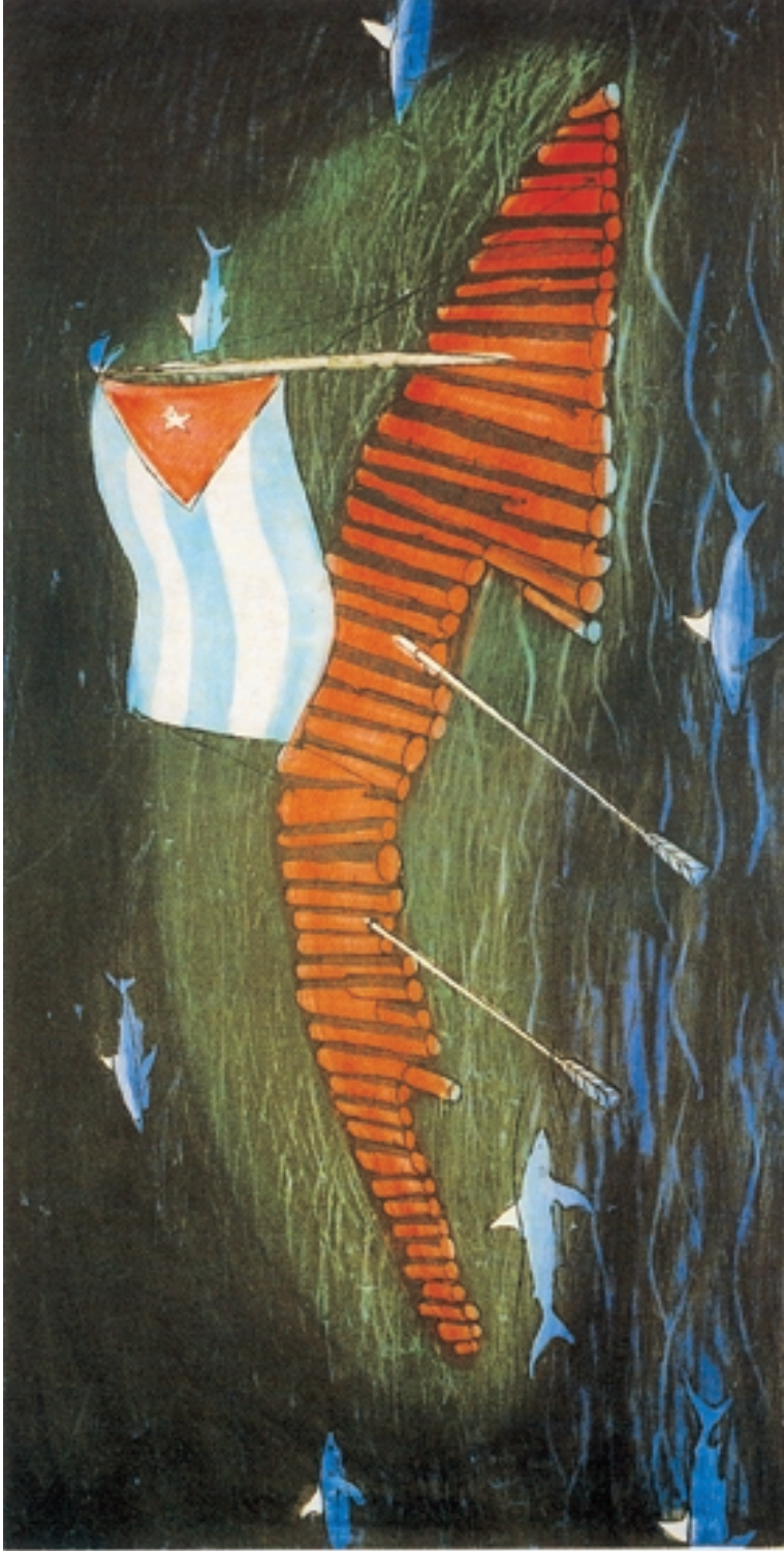
La balsa (1994)