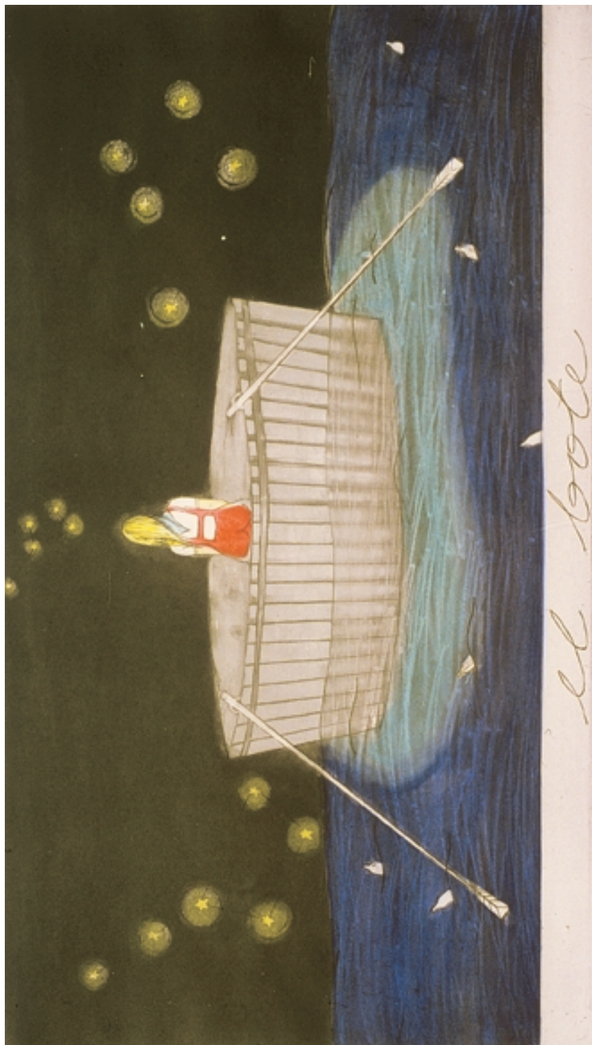
El bote (1994)