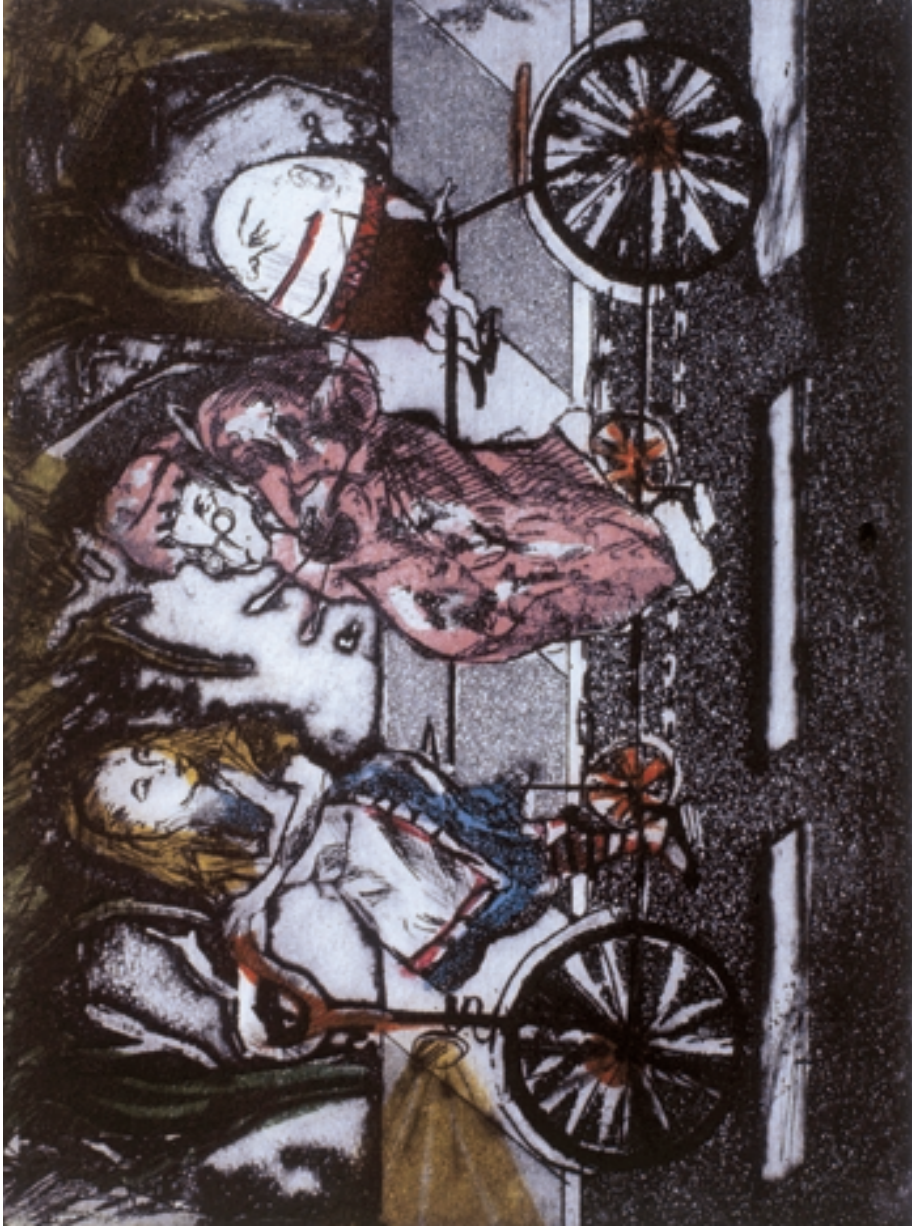
El último de los viajes IV (1900)