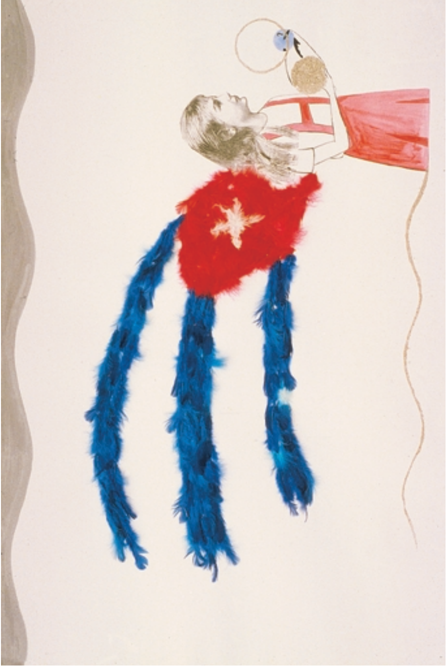
Los enigmas de la identidad (1997)