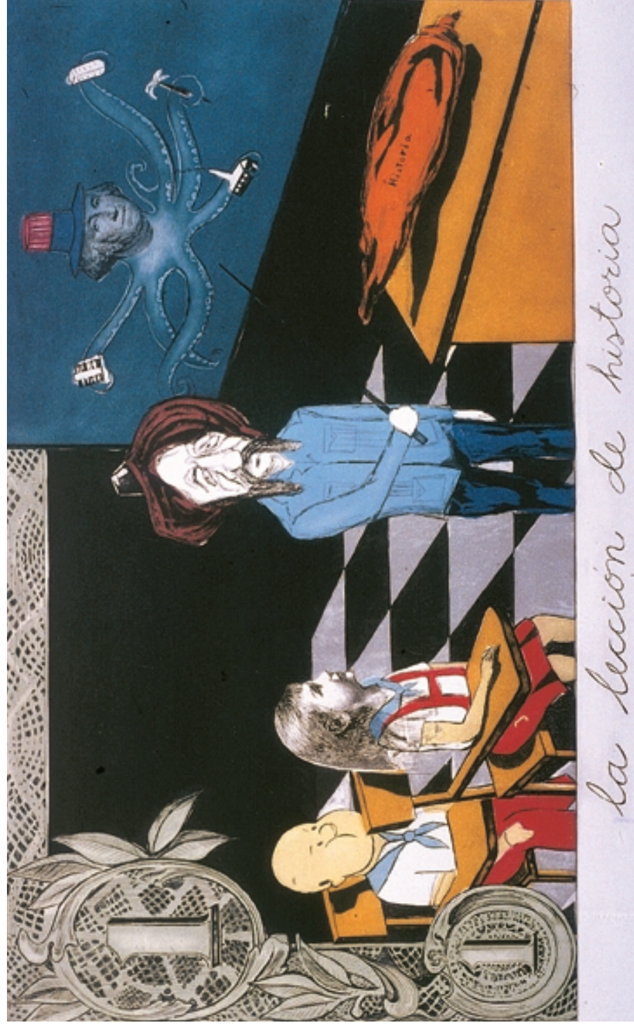
La lección de historia (1996)