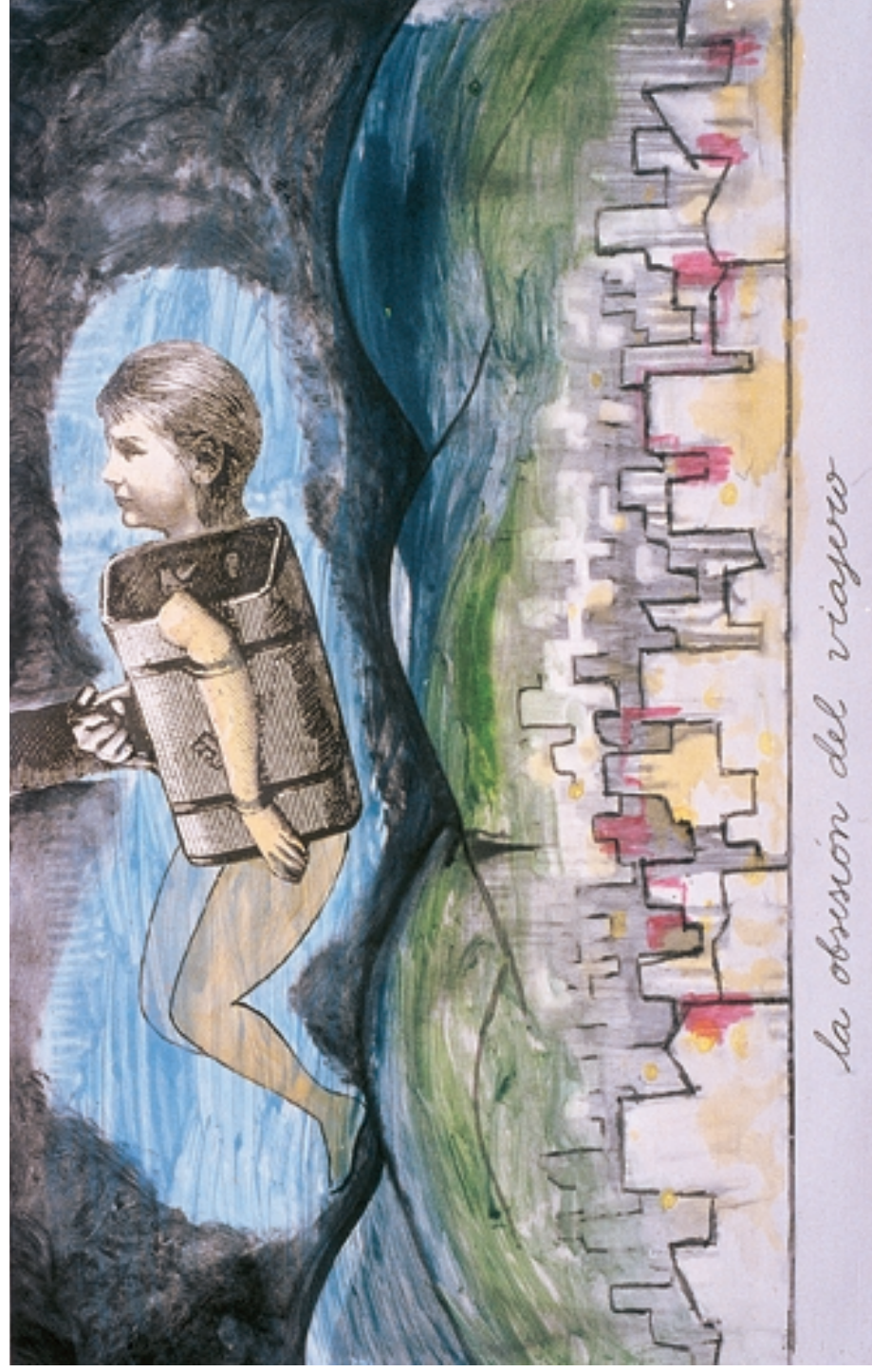
La obsesión del viajero (1997)