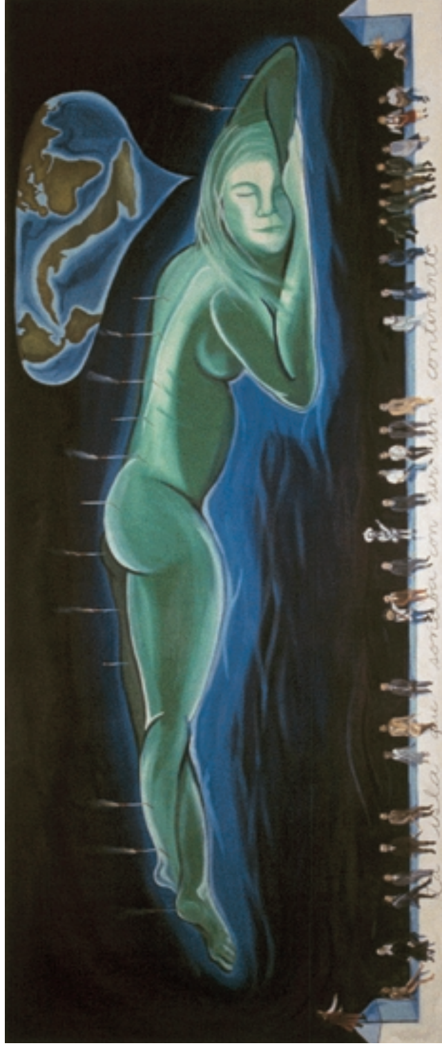
La isla que soñaba con ser continente (1995)