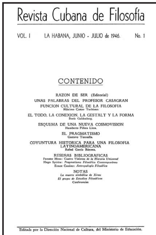
Portada del n.º 1 de la Revista Cubana de Filosofía .